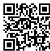
桃園市國民小學藝術才能國樂班 鑑定線上報名系統