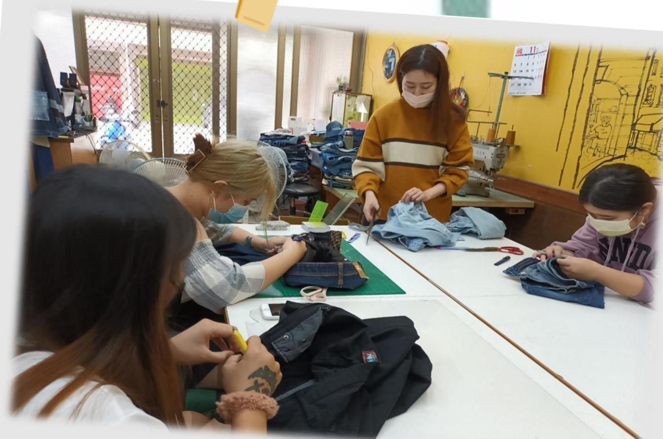
企業參訪-木匠的家