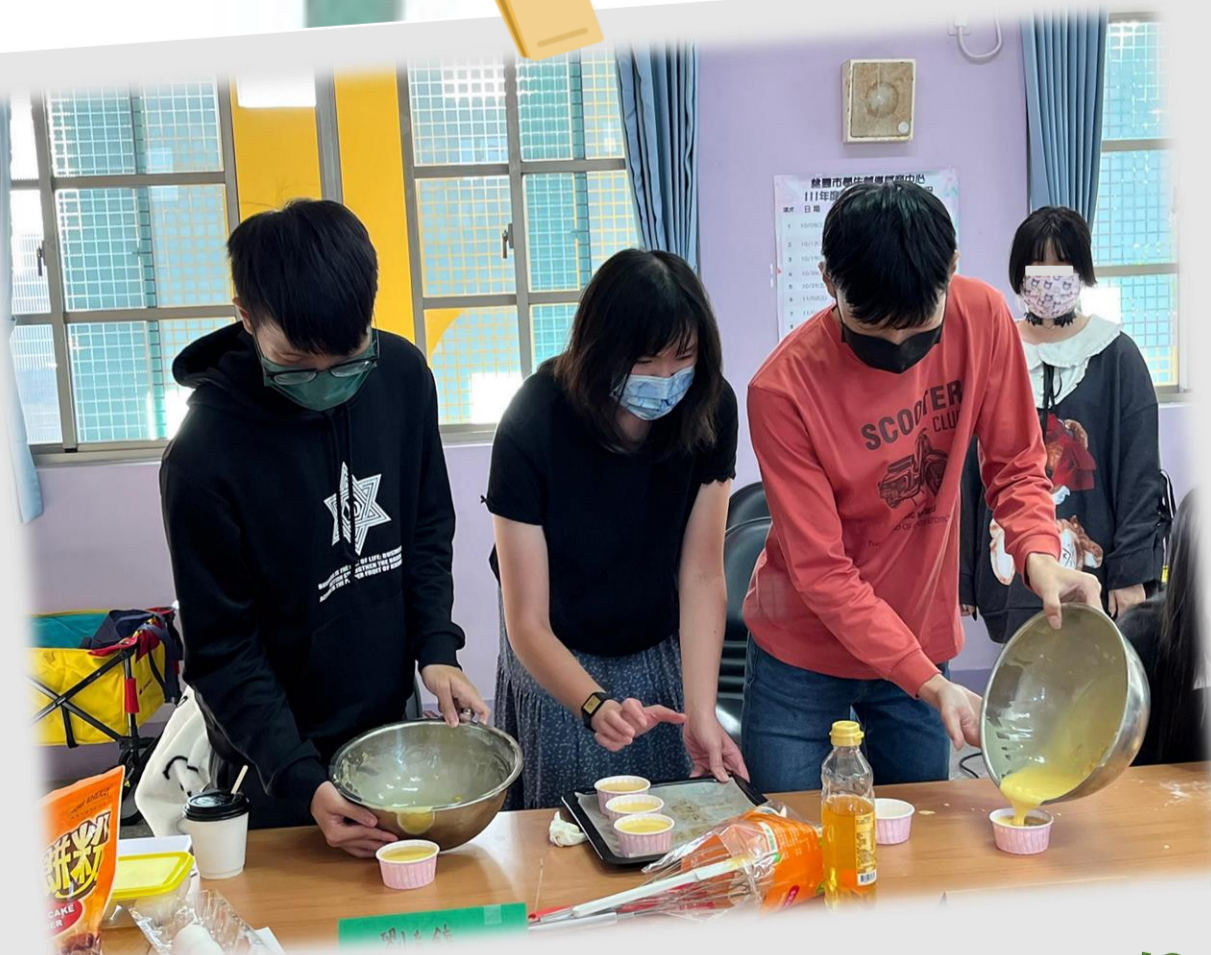
生涯探索-烘焙體驗