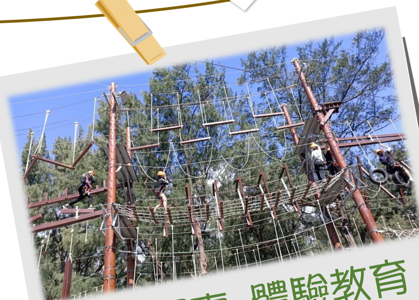
戶外探索-體驗教育