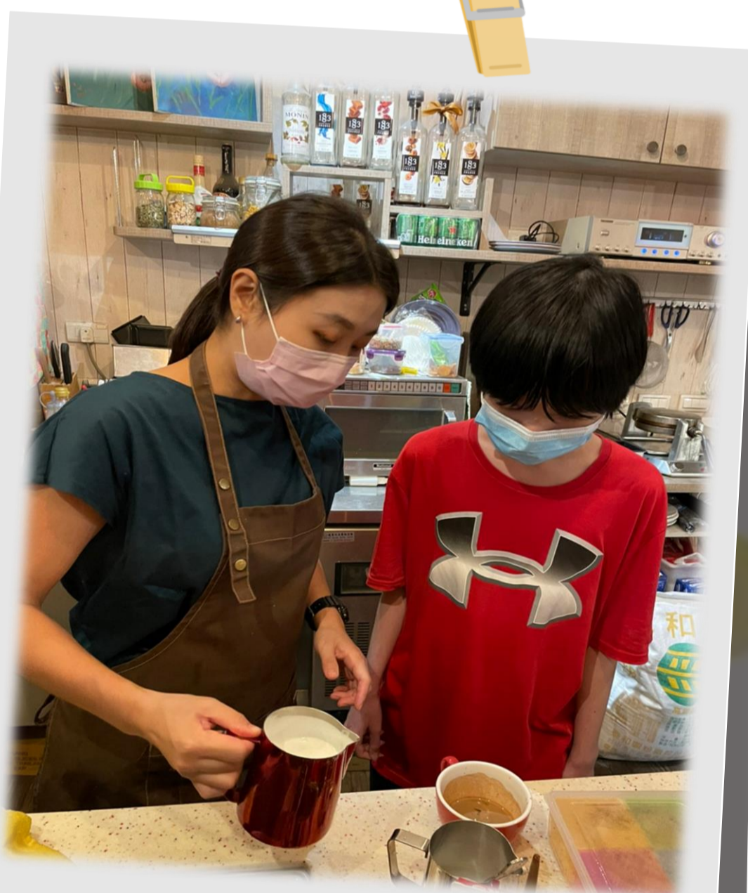
就業培力-咖啡學習