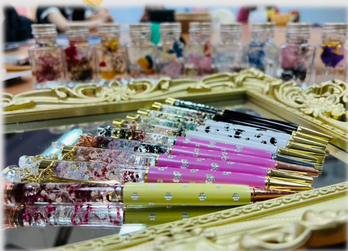
學員作品-浮游花筆